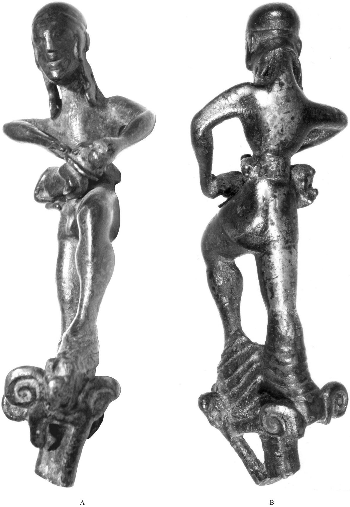
1. A-B, 'Guerrero sacrificando un carnero' de La Puerta de Segura, Jaén, visto de frente y por detrás